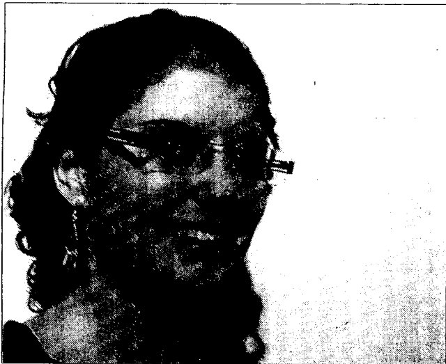
Elle est née à Dijon, elle étudie à Lyon et dans deux ans, elle s'installe à Paris. Une nouvelle ville à faire découvrir.

issait servi- inale- dense r site t son bon gner ssan- te de